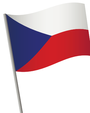
česká (československá) vlajka